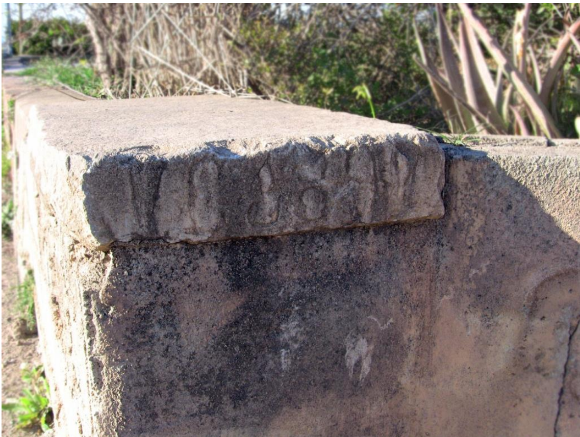
La inscripció diu: “AÑO 1892”.