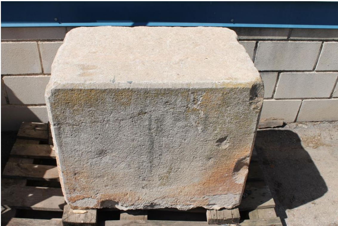
La segona “Pedra dels morts” dipositada al magatzem municipal.