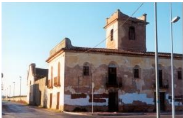
El Replà en una imatge dels anys 90, abans que caiguera la torreta.

El Replà es considera “la mare” de les Alqueries, perquè l’oratori del frares de Caudiel, dedicat a la Mare de Déu del Niño Perdido, va aglutinar i va donar identitat als pobladors de les nombroses alqueries. Anem a fer trampa i a citar la descripció que se’n fa a la web municipal: