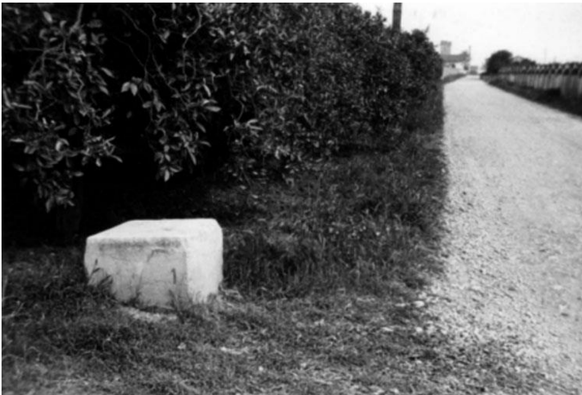
La segona “pedra dels morts”, aleshores ja en desús, cap a 1970, en el seu emplaçament, a l’altura del camp de futbol de les Alqueries. En este punt es despedia part de la comitiva que acompanyava el difunt. A l’altre costat de camí veiem el tancat de Torre la Mina i al fons l’edifici del Replà amb la torreta intacta.