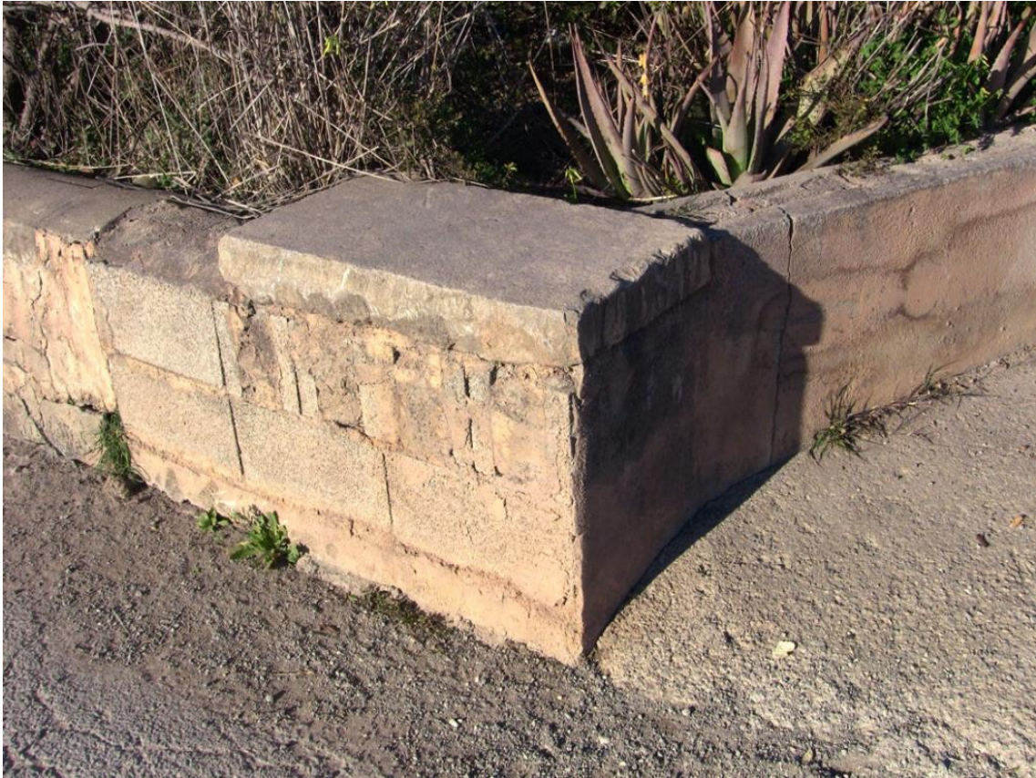
La llosa que corona el ribasset és una de les “pedres dels morts”, que va ser moguda però respectant aproximadame seua ubicació original.